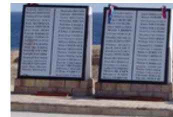
Mindesmærke for ulykken i Sharm el-Sheikh (januar 2004)